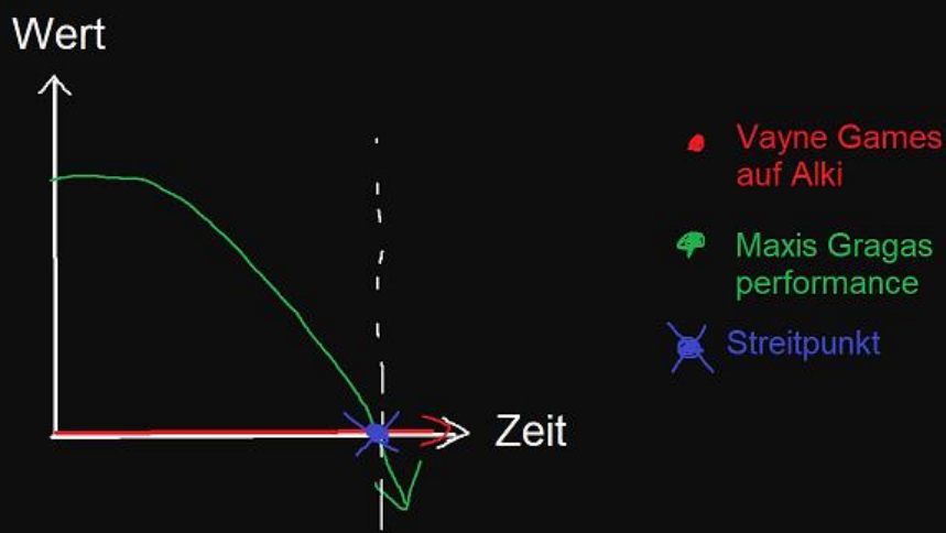
Abb. 2.1: Auslöser der Streitigkeiten

Wie uns aus jüngsten Tagen bekannt wurde, ging die Feindschaft der beiden Erzrivalen in die nächste Runde, Auslöser soll wohl das Turnier gewesen sein.