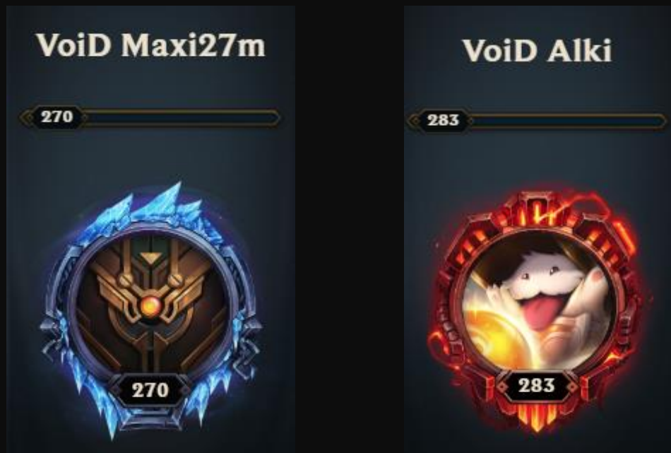
Abb. 2.0: Das sind Maxi und Bruno

Und zusammen definitiv keine gute Kombination.